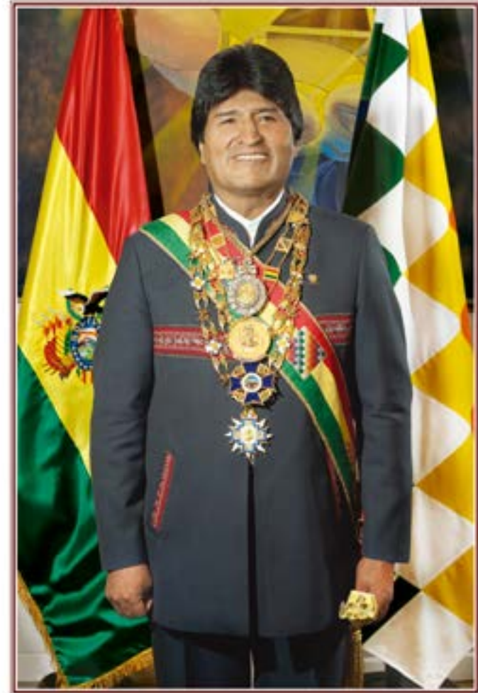
EVO MORALES AYMA Primer Presidente Constitucional del Estado Plurinacional de Bolivia